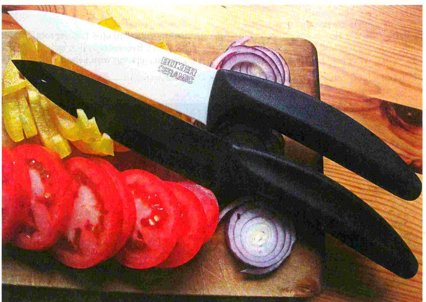
Scharf und spülmaschinenfest: Allzweckmesser aus Keramik von Böker mit Kunststoffgriff