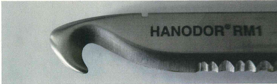
Abbildung 4: Rettungswerkzeug aus Feststellungsbescheid Z 20, Detailaufnahme Klinge