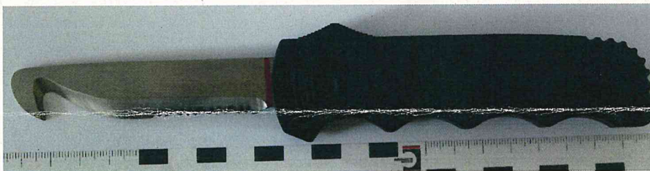
Abbildung 1: „Böker Rettungswerkzeug“ mit ausgefahrener Klinge

der Firma Heinr. Böker Baumwerk GmbH Solingen.